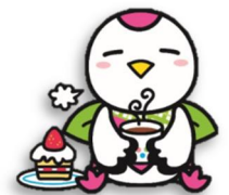
鶴見区マスコットキャラクター 「つるりっぷ」