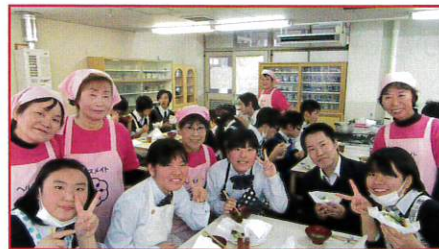
「減塩スキルアップ事業・若者世代」(茨田高校にて)

「無駄なくおいしくいただきました。ありがとうございました。」と、鶴見区食生活改善推進員協議会(ヘルスメイト)さんからお礼のコメントをいただきました。