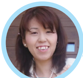
講師プロフィール