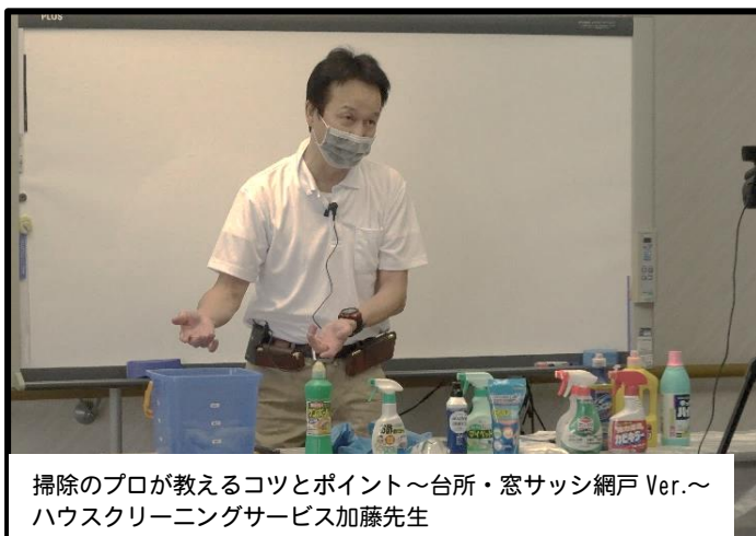
掃除のプロが教えるコツとポイント～台所・窓サッシ網戸 Ver.～ ハウスクリーニングサービス加藤先生