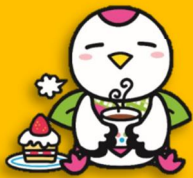
鶴見区マスコットキャラクター