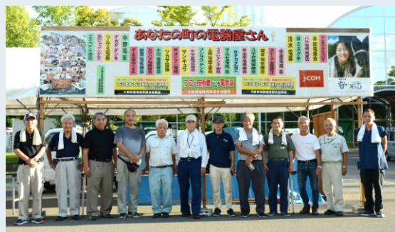
鶴見区民まつりで「困りごと相談」を毎年実施しています