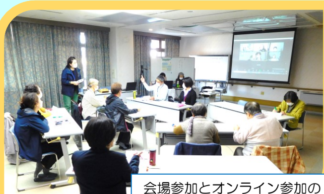
会場参加とオンライン参加のハイブリッド型で開催

< 第2部 > 区内のいろいろな『サロン』の運営者や、『サロン』に興味のある住民の方々との情報交換会をおこないました。