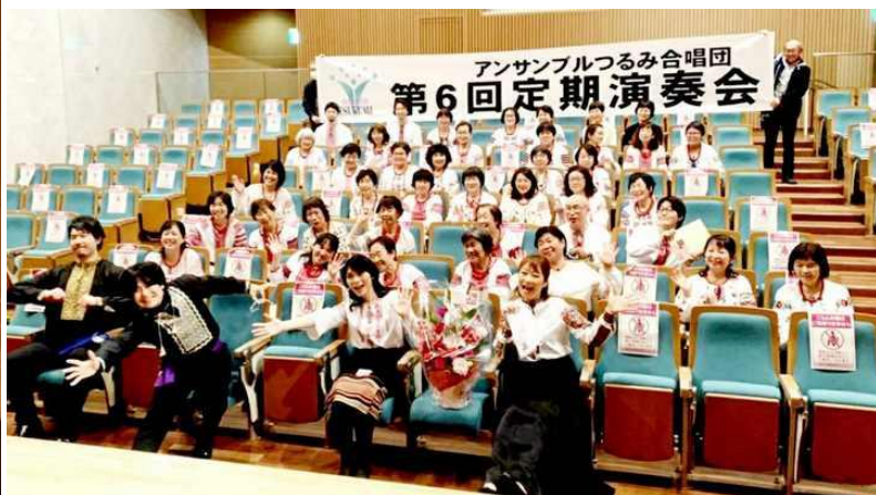
定期演奏会後、リラックスしているメンバー