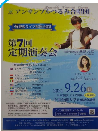
第7回 定期演奏会チラシ