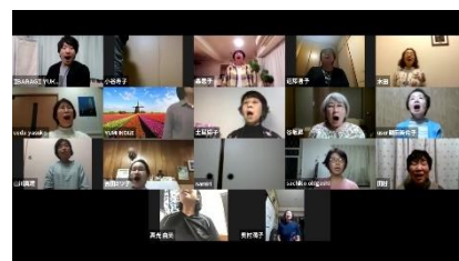
ZOOMで練習している様子