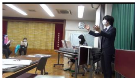
緊急事態宣言解除後のわずかな期間の時は2回だけでしたが、対面練習ができました。