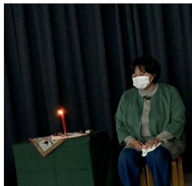
「冬のこわ〜い 楽しいおはなし会」

1本のろうそくに火が灯され、おはなし会が始まります。本など何も持たずに語るストーリーテリングです。どなたでも参加できます。詳しいことは鶴見図書館HP・広報つるみで案内されています。