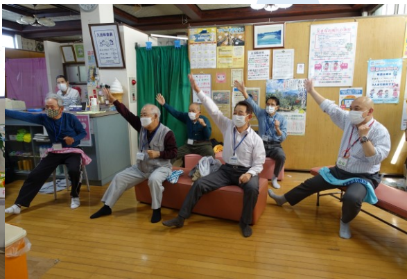
健康体操 ワンツー！ワンツー！