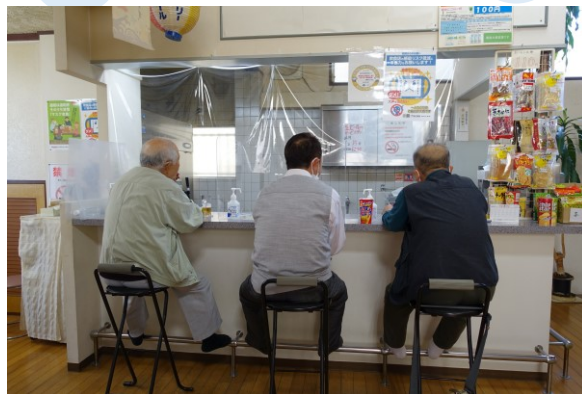
入浴後は俺たちの座談会

今津地域限定、4月から始まりました男性の集いの場「俺の風呂倶楽部」は6月で3回目の開催を迎えました。「心も体も健康に」をモットーに健康体操を30分。新朝日温泉の究極の一番風呂に入ります。参加者の方からは、「肩の痛みが取れたわ」また参加者の奥様からは「楽しんできてね！」とエールをもらい今津地域「俺の風呂倶楽部」は毎月第2水曜日 12時30分～2時まで 場所は新朝日温泉さんで 絶賛開催中！