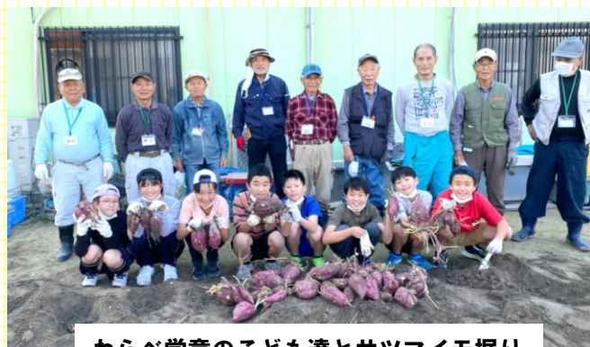
わらべ学童のこども達とサツマイモ掘り

先輩ボランティアさんが、安田2丁目の畑で教えてくれますよ。 ※長靴・軍手と水分補給の飲み物をご持参ください。 詳しくはお問合せください。