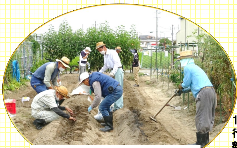
収穫した野菜をこども食堂などへ無償提供するボランティア活動をしています。