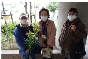
12月9日 丹精込めてお世話をしてきたユリが育ち、「嬉しい！」と言われていました。