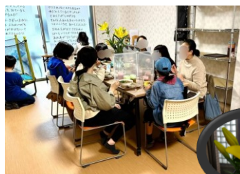
12月3日 こども食堂では、「きれい！」と参加されたこどもさんの声も。