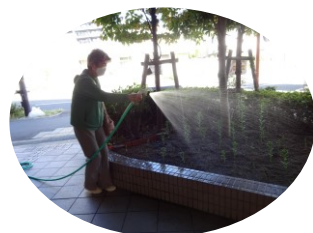
10月13日 水やり当番を決めて育てました。