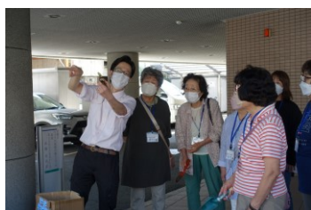
9月30日 なにわ花いちばの職員さんのお話に興味津々。

なにわ花いちばを通して寄付していただいた「LAユリ」を球根から育てて、区内のこども食堂にプレゼントしました。