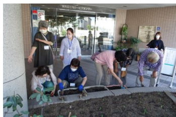
9月30日 みんなで手分けして球根を植えました。