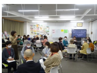
第2回 12月7日（木） 「しんどくならない話の聴き方」