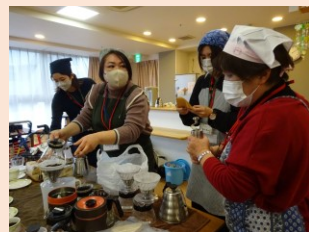
高齢者施設に出張カフェ で活動中

開催日時：毎月第3金曜日 午後2時～3時30分 開催場所：鶴見区在宅サービスセンター 2階ボランティアルーム