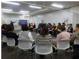
第1回 11月30日（木） 「傾聴の基本を知る」

傾聴ボランティア養成講座（3回連続講座）を開催しました！ 11月30日～の講座で延べ80人参加されました