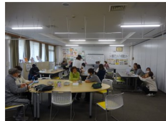
第4回 11月24日（金） 「つるりっぷカフェで 実演してみよう」