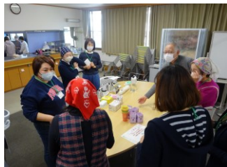
第3回 11月17日（金） 「カフェの模擬練習」