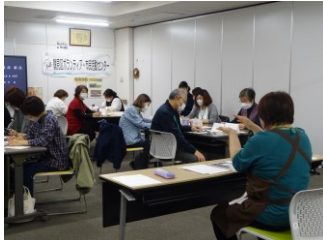
第2回 11月10日（金） 「ドリップコーヒーの淹 れ方を学ぼう」