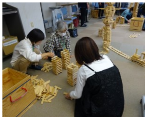
第1回 10月27日（金） 「カプラでチームワーク を高めよう」

カフェボランティア養成講座（4回連続講座）開催しました！ 10月27日～の講座で延べ64人参加されました