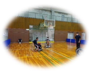
車イスバスケットボール