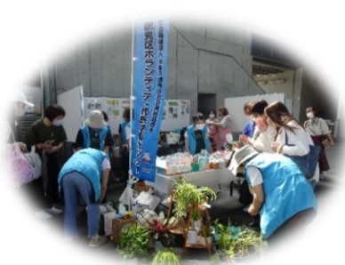
ボランティア連絡会活動紹介