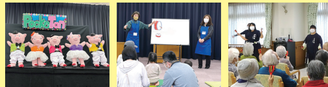
つるみ人形劇団ポケッとん 絵本の会鶴見 ソーリヤはなてん 夢舞隊chihaya